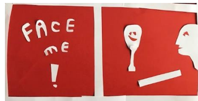
Egen övning vid tidigare affischworkshop